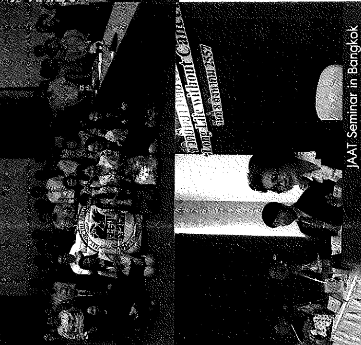
JAAT Seminar in Bangkok

Website : www.jps-th.org Facebook : JSPS Bangkok Office